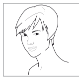
disponibil și în varianta pentru adulți